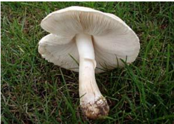
Weißer Knollenblätterpilz ( Amanita virosa )

Zu den häufigsten und bekanntesten Pilzen im Rasen gehört der Feldegerling oder Wiesenchampignon ( Agaricus campestris ). Er hat keinen Einfluss auf das Gräserwachstum. Der schmackhafte Pilz hat einen weißen Hut unter dem sich zunächst rosafarbene und im älteren Zustand dunkel schokobraune Lamellen befinden.