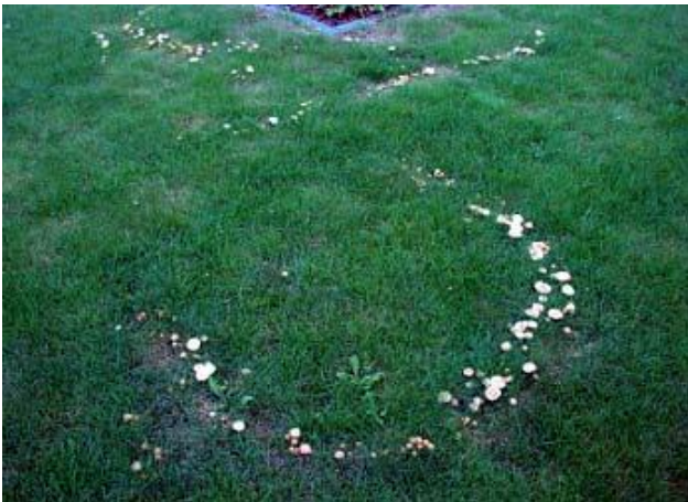
Nelkenschwindling ( Marasmius oreades ), eine mögliche Ursache für den Hexenring.

Auffällig ist, dass die Fruchtkörper vieler Pilze (u.a. Wiesenchampignon, Knollenblätterpilz und Nelkenschwindling) in kreisrunder Anordnung erscheinen.