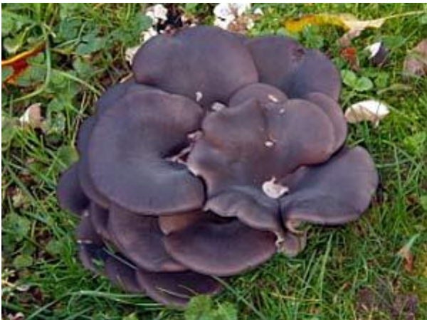
Austernseitling, er lebt auf Holz, das sich im Boden verbirgt.

Für jedermann sichtbar hat in diesen Tagen die Pilzsaison begonnen. Jetzt schießen sie wieder sprichwörtlich aus dem Boden. Aber woher kommen sie, wie konnten sie entstehen und wovon leben die Pilze im Rasen? Sind sie gefährlich? Sollte man sie bekämpfen?